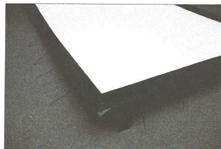
3 Von vorn sieht das Ganze dann so aus: komplett faltenfrei und mit dem gewünschten Krümmungsgrad