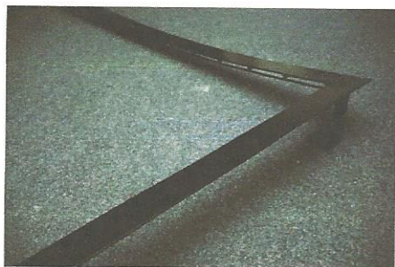
1 Die vier Seitenteile der Rahmenkonstruktion sind individuell gefertigt und gebohrt und müssen genau zusammengesetzt und verschraubt werden. Die Rahmenfarbe ist fast frei wählbar, es lässt auch eine lichtabsorbierende Kaschierung aufkleben